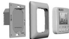
Схема сборки терморегулятора для установки в монтажную коробку.

Закрепить терморегулятор в монтажной коробке. Для чего нужно аккуратно снять лицевую рамку нажав на пластиковые защелки отверткой, поместить терморегулятор в монтажную коробку и закрутить монтажные винты. Затем надеть рамку и придерживая ее рукой, вставлять лицевую панель регулятора в рамку до полного срабатывания крепежных защелок.